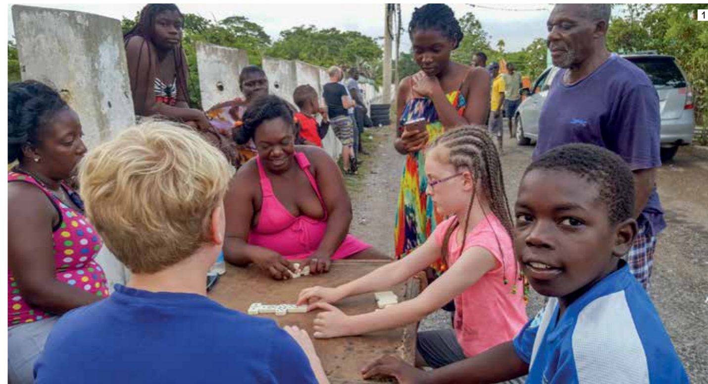
1. משחק השולחן הפופולרי בג'מייקה הוא ככל הנראה הדומינו. במפגש עם אוכלוסייה מקומית, באמצע רחוב צדדי בעיירה בלאק ריבר, זכינו לשחק איתם ולהנות במשך כמה שעות. 2. הבלאק ריבר, הזורם בעיירה העונה לאותו שם, הוא אחד המקומות היפים במסע לג'מייקה. השיט בנהר מספק מפגש עם ציפורים, צמחייה עבותה ואפילו תנינים. 3. כ-500 תנינים חיים לאורכו של הבלאק ריבר. לפעמים אחדים מהם בורחים אל העיר, וכשהם נתפסים הם מועברים למקלט לתקופה של כמה חודשים, שם יש למבקרים אפשרות להכיר מקרוב את החיות הטורפות האלה.