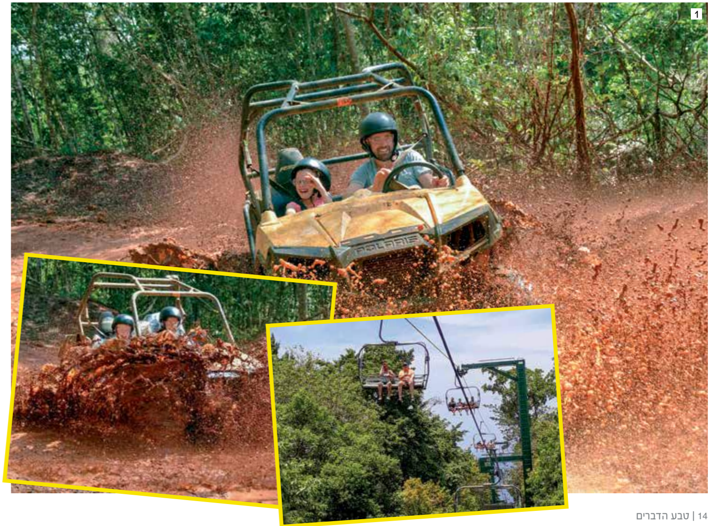
1. שתיים מהאטרקציות המרכזיות בעיר אוצ'ו ריוס: Yaaman, שבה ניתן ליהנות מחוויה אקסטרימית של נהיגת באגי באזור בוצי בתוך יער, וכן טיול ב"מעלון סקי" על צלע הר באתר Mystic Mountain.

האוקיינוס מתגלה מעת לעת ברקע. ברום ההר ניתן לעשות טיול על גבי מזחלות (Bobsled tour), טיול אקסטרים מהיר שמעורר את האדרנלין, וכן טיול אומגה בין עצי היער.