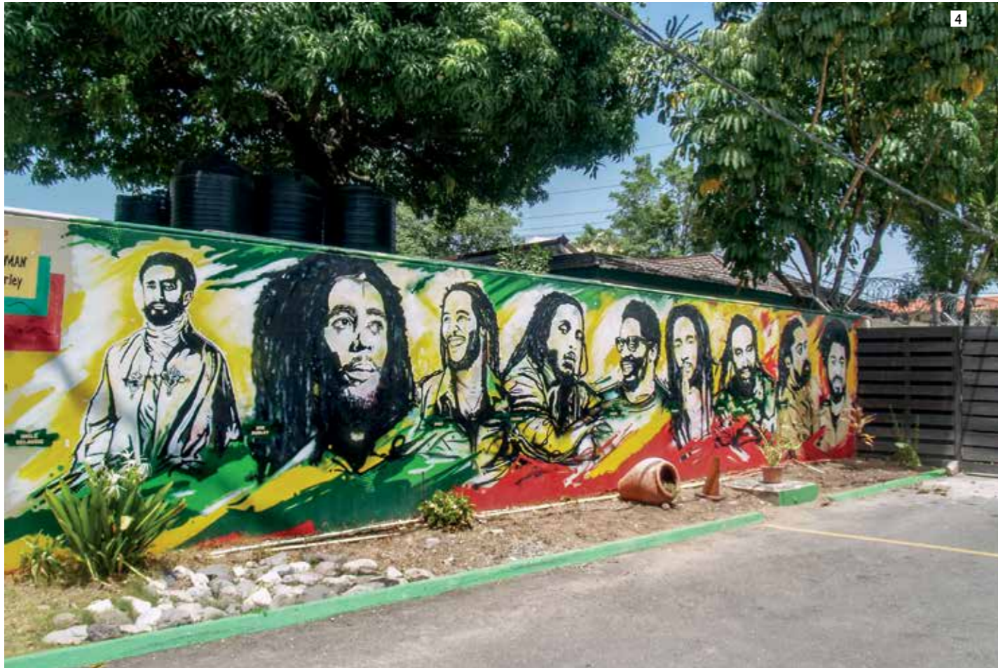
3. בלאק קוש, אחד המתופפים המובילים בג'מייקה וסולן להקת הרגאיי הג'מייקנית "The Uprising Roots Band". קוש מנגן בין השאר עם חלק מהאחים מארלי, ולשמחתי העניק לי כיתת אומן אישית ובלתי נשכחת. ג'מייקה היא גן עדן לחובבי מוזיקה, ובייחוד מסצנת הרגאיי, הסקה והדאב. מוזיקאים מישראל בהחלט יכולים לנסות וליזום מפגש עם מוזיקאים ויוצרים ג'מייקנים מקומיים, שבדרך כלל הם גם חובבי ישראל ומפגש איתנו מעניין אותם לא פחות. 4. צילום בחצר המוזיאון של בוב מארלי, בעיר הבירה קינגסטון. מארלי הוא המלך הבלתי מעורר של ג'מייקה. בכל רחוב תראו תמונות ומזכרות עם דמותו, שריו מתגנבים בכל מקום, והוא שהביא לתודעת העולם את הרגאיי, את תנועת הראסטפאריין, ובכלל את ג'מייקה.